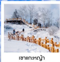
เขาแกะหิมะ