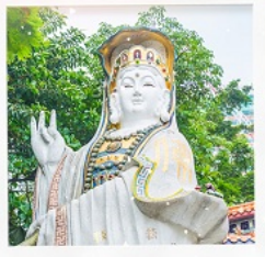
เจ้าแม่กวนอิมธิพลัสสมัย