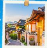
หมู่บ้านนูกซอน