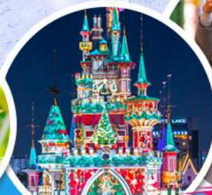
สวนสนุกก็อตเต้