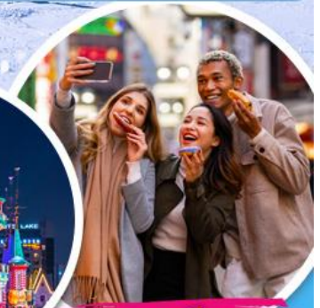
ตลาดเมียงดง