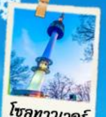
โซลทาวเวอร์