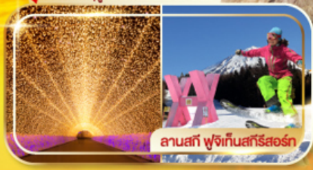
ลานสกี ฟุจิกินสกีรีสอร์ท