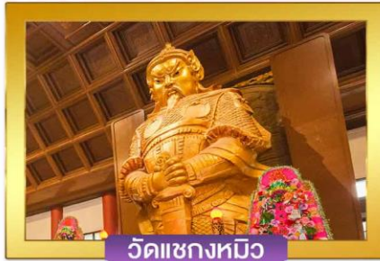
วัดแซงกหมิว