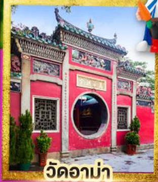
วัดอาบ่า