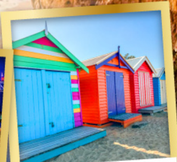
ไบรด์ตัน บาร์ตัง บ็อกซ์

03-10, 12-19 เม.ย.68 24 เม.ย.-01 พ.ค.68 08-15, 22-29 พ.ค.68 29 พ.ค.-05 มิ.ย.68