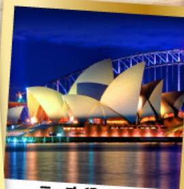
ซิดนีย์โอเปร่า