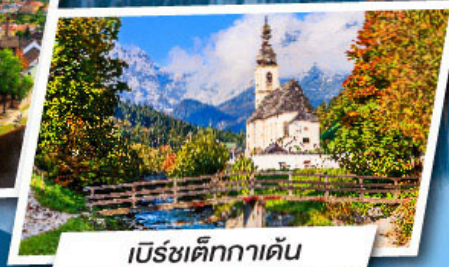
เบิร์ชเต็กกาเดิน