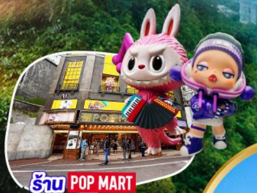
ร้าน POP MART ที่ใหญ่ที่สุดในไต้หวัน