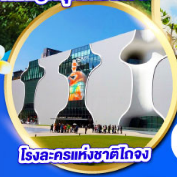
โรงละครแห่งชาติไทจง