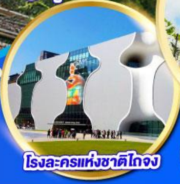
โรงละครแห่งชาติไทจง