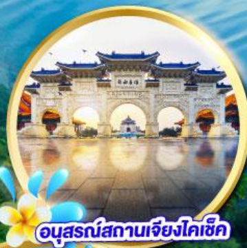
อนุสรณ์สถานเจียงไคเช็ค