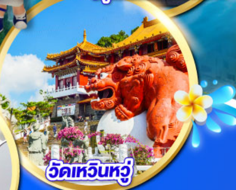
วัดเหวินหวู่