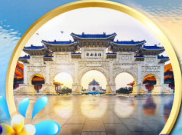
อนุสรณ์สถานเจียงไคเช็ค