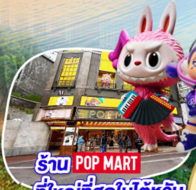
ร้าน POP MART ที่ใหญ่ที่สุดในไต้หวัน