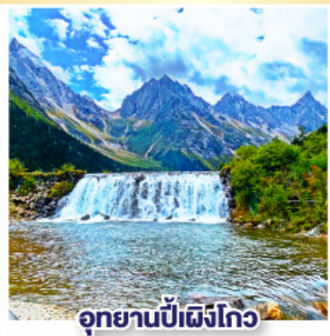
อุทยานป้าฝิ่งโกว