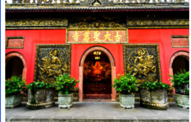
วัดต้าจื่อ