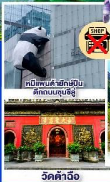
หมีแพนด้ายักษ์ปิ่น ตึกถนนชุนซีอู๋