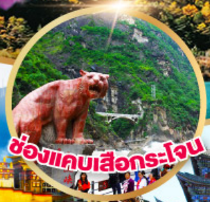
ช่องแคบเสีอกระโจน