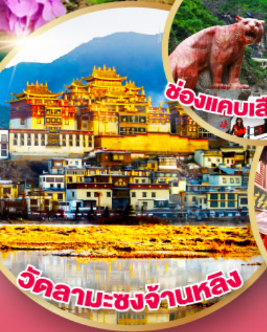
วัดลามะชงจ้านหลิง