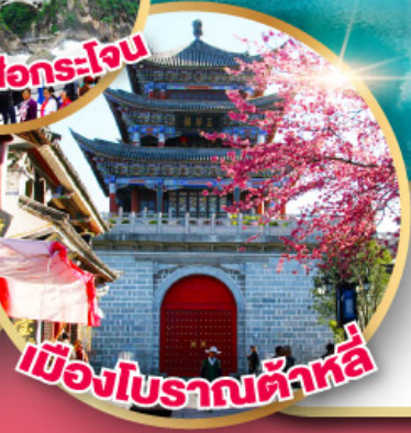
เมืองโบราณต้าหลี่