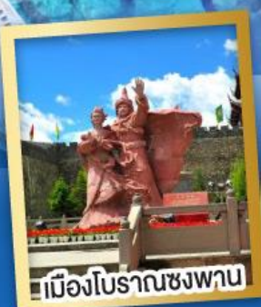
เมืองโบราณชงพาน