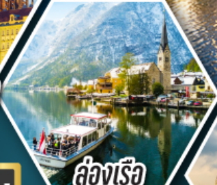
ล่องเรือ ทะเลสาบอัลสติก