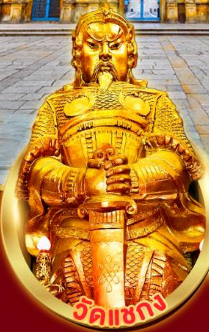
วัดแซกซง