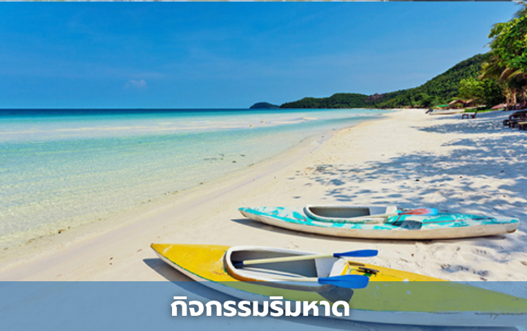
กิจกรรมริมหาด