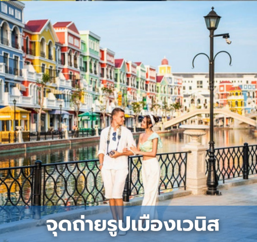
จุดถ่ายรูปเมืองเวนิส