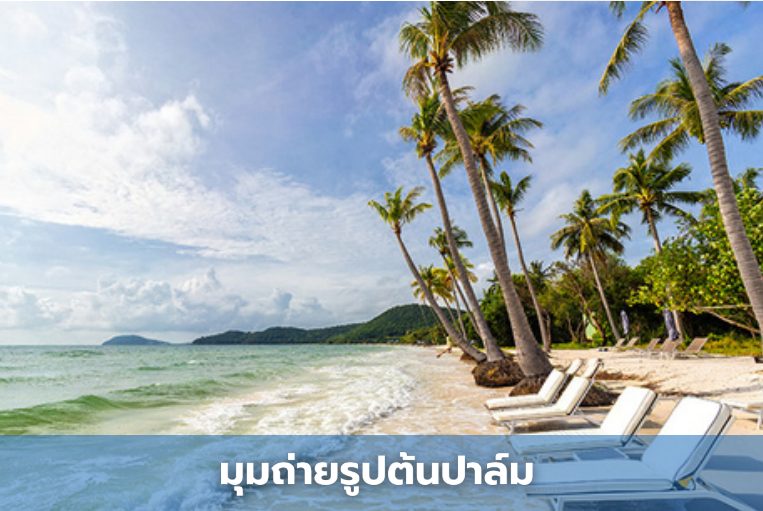
มุมถ่ายรูปต้นปาล์ม