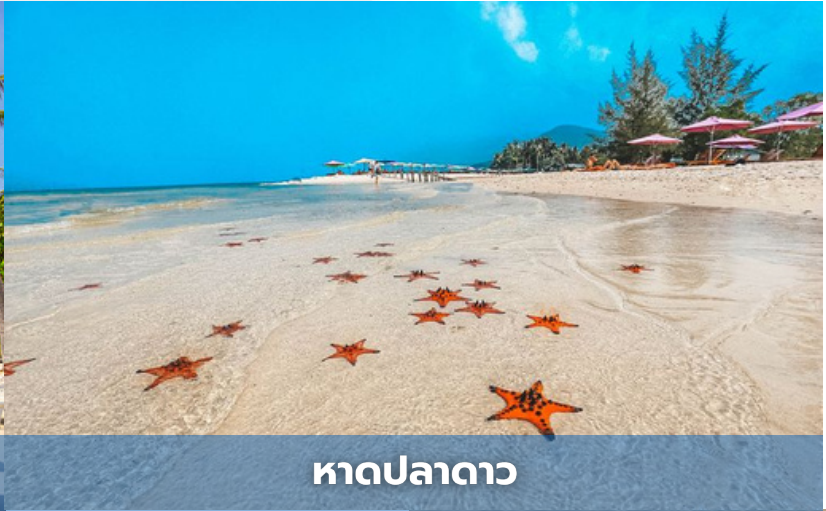
หาดปลาตา