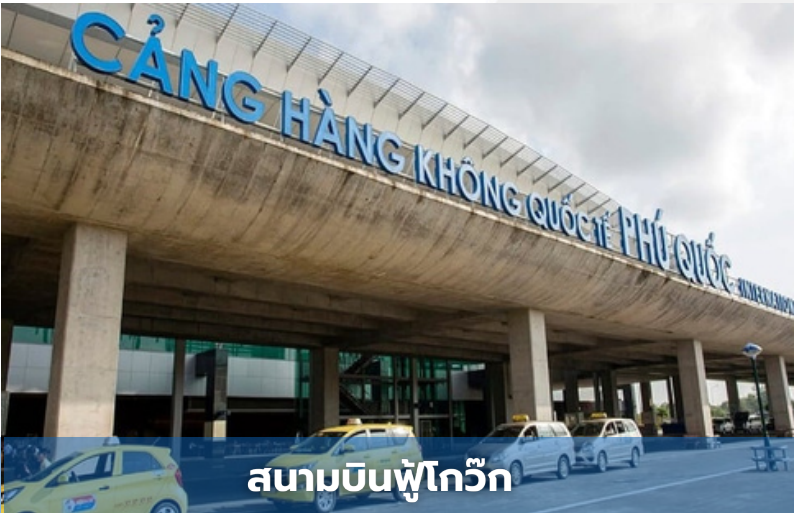
สนามบินฟูโก๊วก