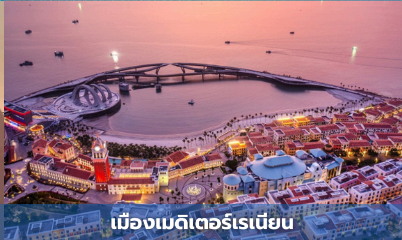
เมืองเมดิเตอร์เรเนียน