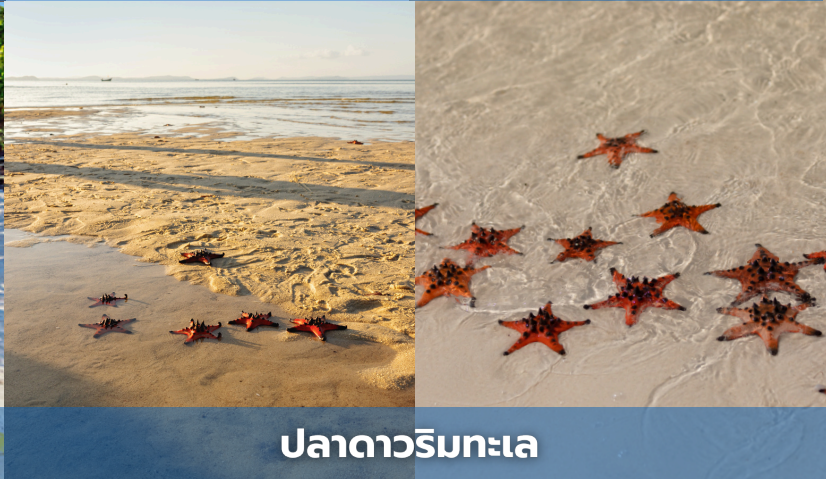
ปลาตาหิมะทะเล