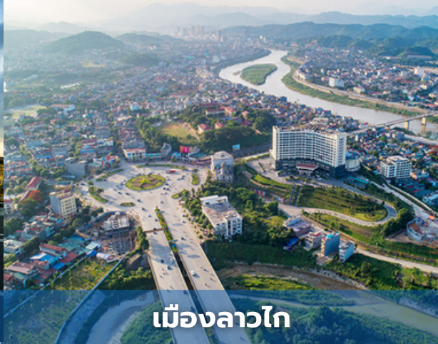
เมืองลาวไก