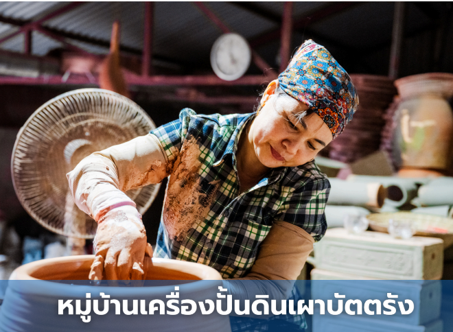
หมู่บ้านเครื่องปั้นดินเผาบัตตัง