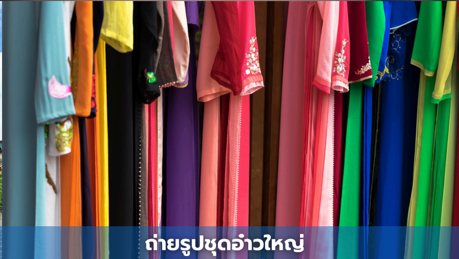
ถ่ายรูปชุดอ่าวใหญ่