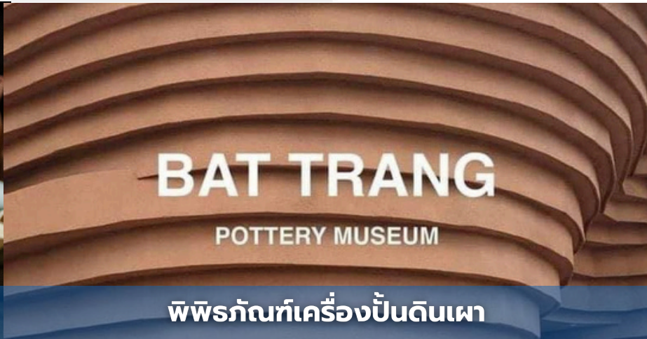
BAT TRANG POTTERY MUSEUM