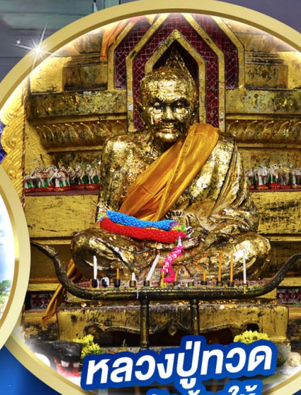
หลวงปู่ทวด ณ วัดช้างให้