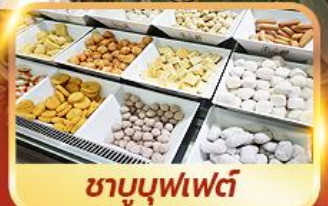
ชาบูบุฟเฟต์