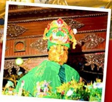
ขอพรแม่ยักษ์