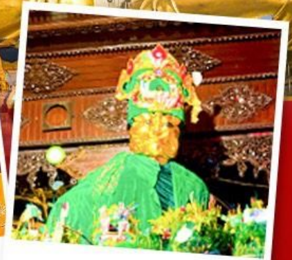
ขอพรแม่ยักษ์