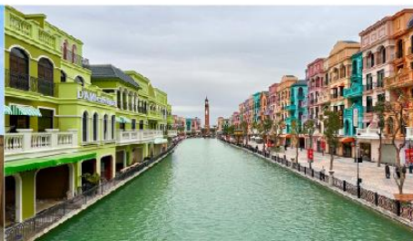
เมก้าแกรนด์เวิลด์ฮานอย