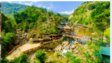
หมู่บ้านก๊อต ก๊อต

*ทางบริษัทฯ ขอสงวนสิทธิ์ในการสลับโปรแกรมทัวร์ตามความเหมาะสมขึ้นอยู่กับสถานการณ์หน้างาน โดยคำนึงถึงผลประโยชน์ของลูกค้าเป็นสำคัญ