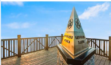
ยอดเขาฟานซิปิน