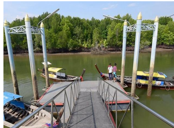
นั่งเรือลอดอุโมงค์ป่าโกงกาง ชมธรรมชาติ ของปากกลางน้ำแหล่งเพาะพันธุ์ปลากะปิ