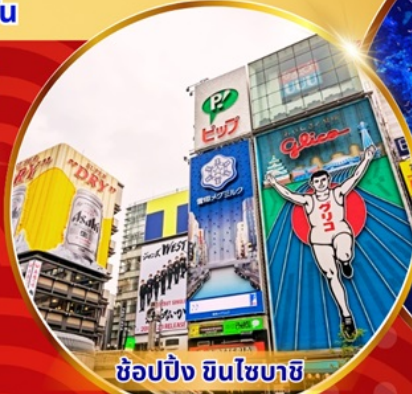
ซูปปิ้ง ซินโซบาชิ