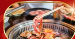
บุฟเฟ่ต์ปิ้งย่าง ไม่อั้น

KOREAN AIR บริการอาหารร้อน peach เอนเตอร์เทนเมนท์ฟรี