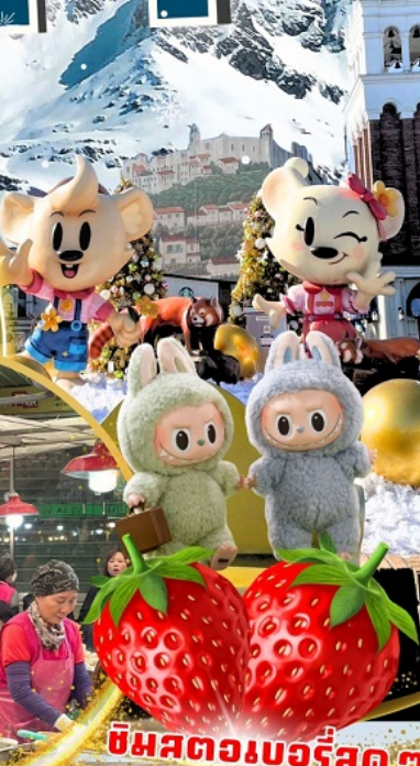
ตลาดกวางจ็อง