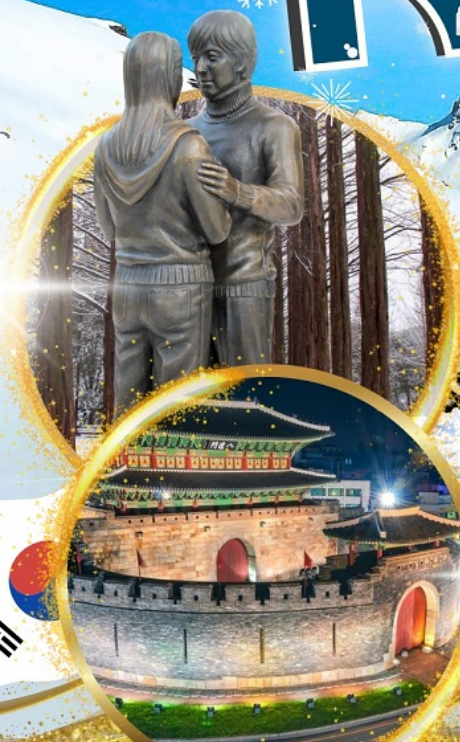
ป้อมฮวาซอง