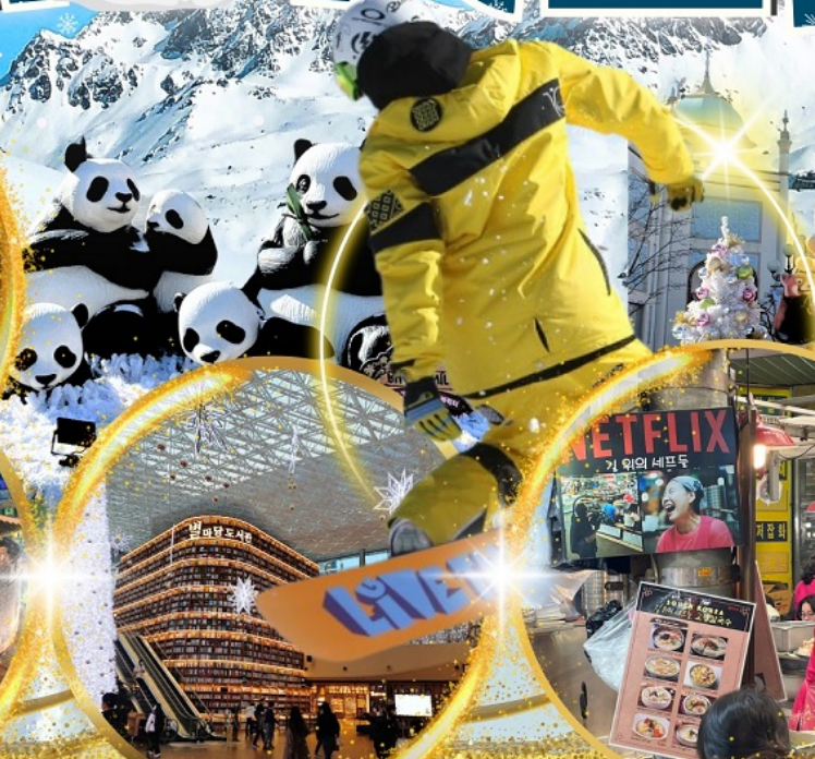
ห้องสมุด Starfield