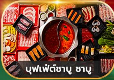
บุฟเฟ่ต์ซาบู ซาบู