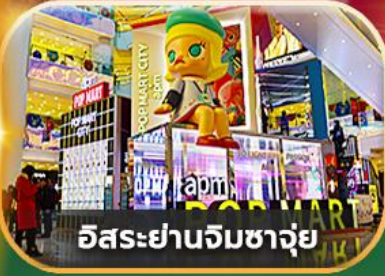
อิสระยานจิมซาจุย