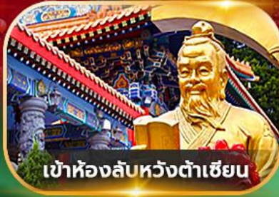
เข้าห้องลับหวังต้าเซียน