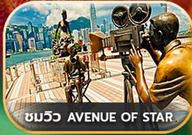
ชมวิว AVENUE OF STAR