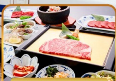
บึงย่างร้านดัง ROKKASEN