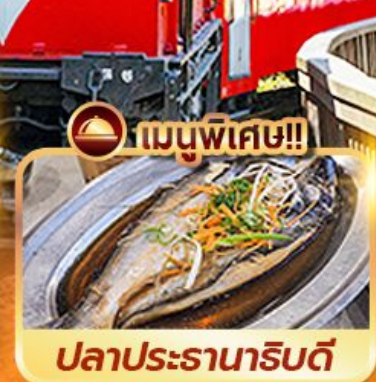
เมนูพิเศษ!! ปลาประดานาธิบดี