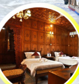
บ้านเรือ..วิมานบนดิน