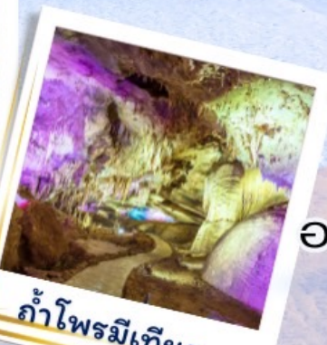
ถ้ำไฟรมีเทียส