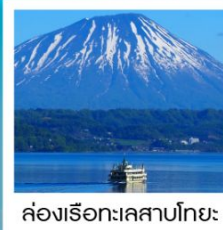
ค่องเรือทะเลสาบโทเยะ