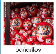
วัดคิตสึโอจิ