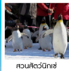
สวนสัตว์นิกะ

วัดคิตสึโอจิ / ปราสาทโอซาก้า / ย่านชินไซบาชิ ค่องเรือทะเลสาบโทเยะ / โทเรียวคะคุ ทาวเวอร์ โกดังอิฐแดงคานโมริ / นั่งกระเช้าภูเขาอาโตะดาเตะ ตลาดเช้าเมืองฮาโกดาเตะ / สวนสัตว์นิกะ ภารินพาร์ค พิพิธภัณฑ์ค่องดนตรี / นาฬิกาไอน้ำโบราณ โรงเป่าแก้วคิตาอิชิ / เนินพระพุทธรเจ้า / มิซึย เอ้าเค็ทท์