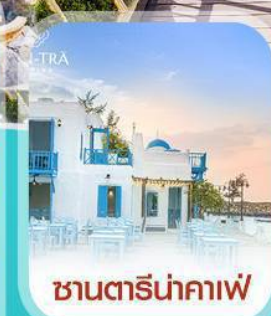
ซานตารีนาคาเฟ่