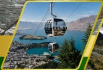
นั่งกระเช้ากอนิดล่า รับประทานอาหาร บนยอดเขาบ็อบพีก