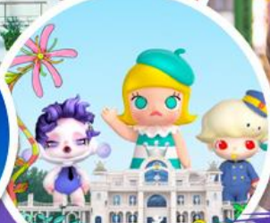
ซื้อบิง POP MART