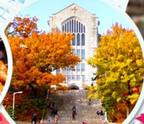
มหาวิทยาลัยฮ็ฮวา