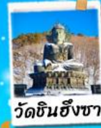
วัดชินฮึงซา