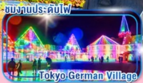
ชมงานประดับไฟ