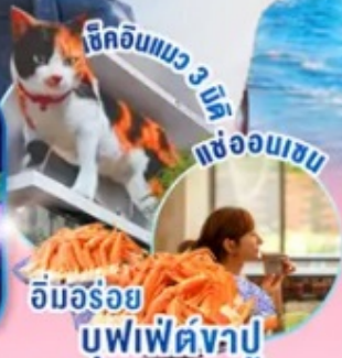
ช็อคอินแมว 3 มิติ