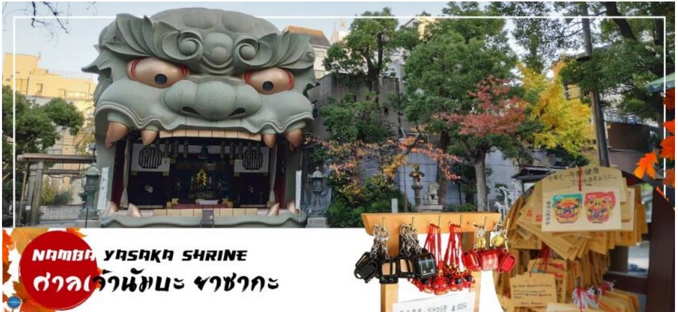
NAMBA YASAKA SHRINE ศาลเจ้านัมมะ ยะซากะ

เดินทางสู่ เมืองโอซาก้า (Osaka) (ใช้เวลาเดินทางประมาณ 1 ชั่วโมง) เมืองที่มีขนาดเศรษฐกิจใหญ่เป็นอันดับ 2 และมีประชากรมากเป็นอันดับ 3 ของประเทศญี่ปุ่น ตั้งอยู่ในภาคคันไซบนเกาะฮนชู ประเทศญี่ปุ่น ปัจจุบันเมืองโอซาก้ามีสถานที่ท่องเที่ยวมากมาย มีแหล่งช้อปปิ้งยอดนิยม มีสวนสนุกขนาดใหญ่ ทั้งยังมีอาหารที่เป็นเอกลักษณ์ เช่น ทาโกะยากิ โอโคโนมียากิ (พิซซ่าญี่ปุ่น) และ คิวคัตตลี