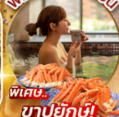
พิเศษ.. ซาปูยึกะ!