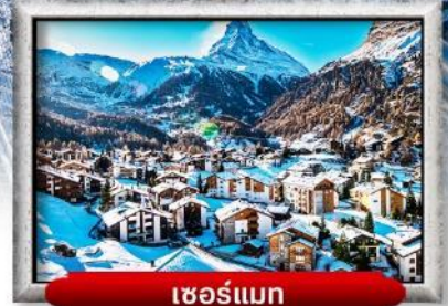
เซอร์แมท

บินหรู สายการบิน Full Service | พิเศษ! ลิ้มลองฟองดู 3 ชนิด