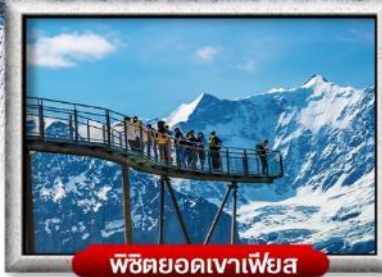
พิชิตยอดเขาเพียส