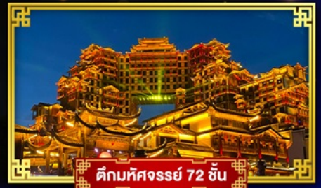
ตึกมหิศงกร 72 ชั้น