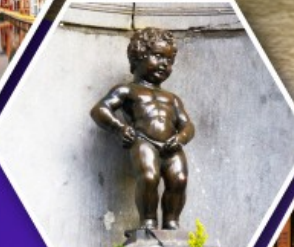
แมนเกินฟิส