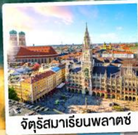
จัตุรัสมาเรียนพลาตซ์