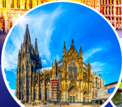
มหาวิหารแห่งโคโลญ หมู่บ้านกีธูร์น