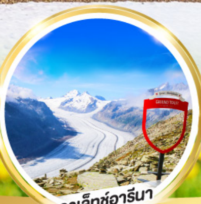
อาเล็กซ์อาร์นิ