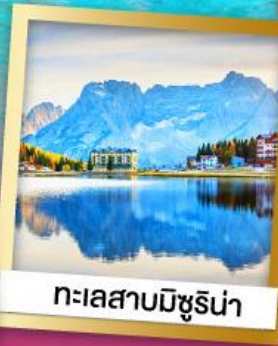
ทะเลสาบมิซูรีน่า