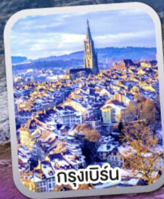
กรุงเบิร์น