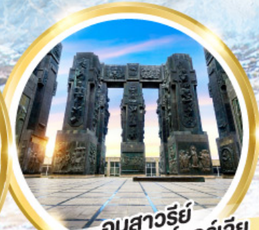
อนุสาวรีย์ประวัติศาสตร์จอร์เจีย