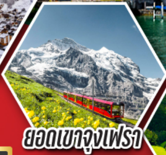
ยอดเขาจุงเฟรา