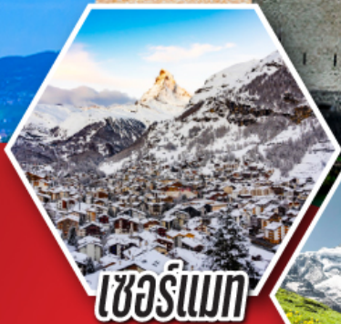
เซิร์นแมท