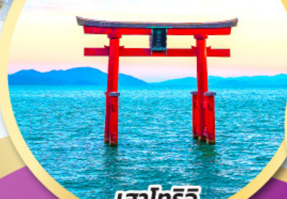
เสาโทริอิ