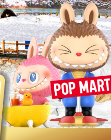
เริ่มต้น