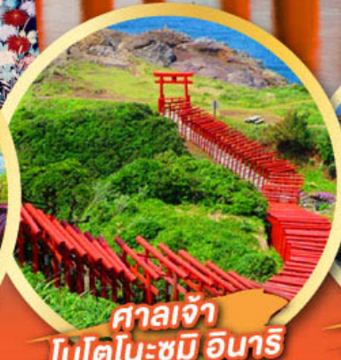
ศาลเจ้า โมโตโนะซุมิ อินาริ