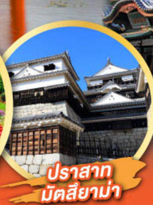
ปราสาท มัตสึยาม่า