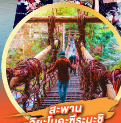
สะพาน อียะโนคะชิระปะชิ