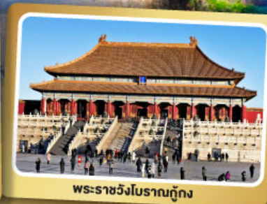
พระราชวังโบราณกู้กง