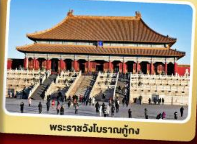
พระราชวังโบราณกู้กง