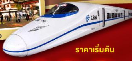
ราคาเริ่มต้น